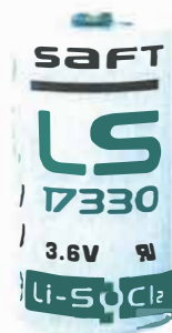
Произведено в Китае