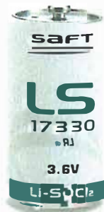
Произведено в Великобритании (производство прекращено)